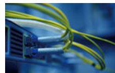
新品PCと古いIPCを保管 別途回線を引いてお客様側の回線と接続