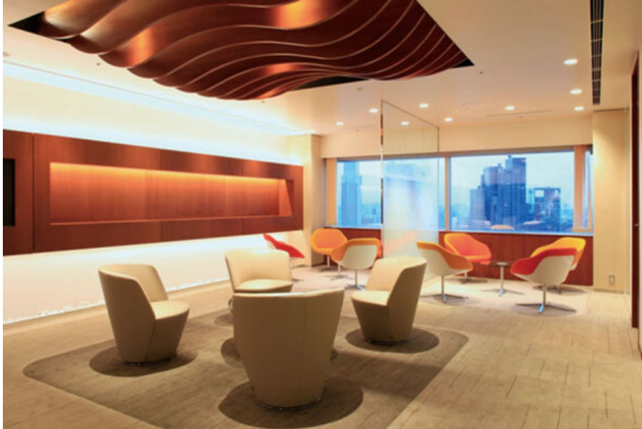
周年コンセプトに沿ったフルリフォームを完工