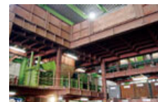
リサイクルセンターで処分