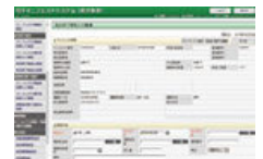
電子マニフェストにも対応