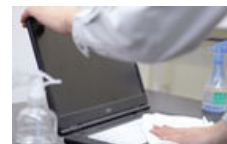
徹底したクリーニング