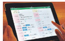
査定用のソフトもセッティング