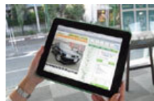
iPadにソフトウェアインストール